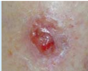
Abbildung 4: Das Basalzellkarzinom (Basaliom) ist die am weitesten verbreitete Form von Hautkrebs und die häufigste Krebsart des Menschen überhaupt.

Es gibt verschiedene Typen des Basalzellkarzinoms – knotige, flache, geschwürartige oder narbenförmige, die einzeln vor allem im Gesicht