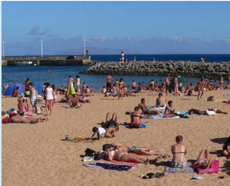
Abbildung 1: Übermäßiges Sonnenbaden fördert das Auftreten von hellem Hautkrebs. Weitere bedeutsame Risikofaktoren sind die Nutzung von Solarien sowie die regelmäßige Ausübung von beruflichen Tätigkeiten unter starker Sonneneinstrahlung.

Doch leider hat die Sonne auch Ihre Schattenseiten: Die schädlichen Folgen von zu intensiver Sonneneinstrahlung kennt jeder, der schon einmal einen Sonnenbrand hatte. Zwar sind die akuten Folgen dieser Entzündung