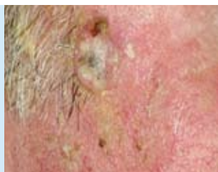
Abbildung 6: Die aktinische Keratose ist eine Frühform des hellen Hautkrebses, die meist in Gruppen oder großflächig verteilt auftritt. Unbehandelt kann daraus ein Plattenepithelkarzinom entstehen.

Aktinische Keratosen (AK) entwickeln sich oft unbemerkt. Sie werden in drei verschiedene Stadien eingeteilt. Im Anfangsstadium (mildes Stadium, AK I) ist nur ein Drittel der Oberhaut, der Epidermis, betroffen, im zweiten Stadium (moderates Stadium, AK II) erstreckt sich die aktinische Keratose auf zwei Drittel der Epidermis, und im dritten Stadium (schweres Stadium, AK III) erfasst sie die gesamte Epidermis. Entsprechend ändert sich das Erscheinungsbild: Anfangs treten die aktinischen Keratosen als kleine gerötete oder rötlich braune Läsionen der Haut auf, bei denen die oberste Hautschicht ausdünn, so dass erweiterte Blutgefäße dort stärker hervortreten. Die Flecken werden später zu flachen rötlichen Knötchen, die graubraun verhornen, oder auch zu schuppigen und krustigen Erhebungen (Abbildung 6).