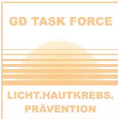
Abbildung 10: Mit dem Ziel, die hellen Hautkrebsformen stärker in das öffentliche Bewusstsein zu rücken, hat die Gesellschaft für Dermopharmazie im Februar 2003 die Task Force „Licht.Hautkrebs.Prävention“ eingerichtet, der Experten aus verschiedenen Fachgebieten angehören. Von dieser wissenschaftlichen Arbeitsgruppe wurde der Begriff „Heller Hautkrebs“ geprägt und verbreitet.

Einen relativ sicheren Schutz vor der Sonne bieten geeignete Textilien. Doch nicht jedes Kleidungsstück schützt gleich gut. Durch helle T-Shirts aus Baumwolle etwa gelangen noch bis zu 20 Prozent der UV-Strahlung auf die Haut. Ein durchnässtes T-Shirt kann sogar bis zu 50 Prozent der UV-Strahlung durchlassen. Selbst spezielle UV-Schutzkleidung gewährleistet keinen hundertprozentigen Schutz. Daher sollte in jedem Fall auch