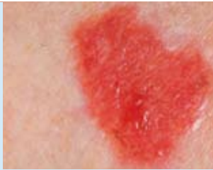
Abbildung 7: Der Morbus Bowen gilt ebenfalls als eine frühe Form des hellen Hautkrebses. Bei nicht rechtzeitiger Behandlung kann sich daraus ein Bowen-Karzinom entwickeln.

Der Morbus Bowen gilt als eine frühe Form des hellen Hautkrebses. Er zeigt sich in Gestalt einer flachen, scharf begrenzten, aber unregelmäßig geformten, rötlich-schorfigen Erhebung, die nässen und verkrusten kann (Abbildung 7). Die Erkrankung tritt vor allem am Unterschenkel, am Rumpf, im Gesicht oder an den Fingern auf und auch an Hautstellen, die kaum dem Sonnenlicht ausgesetzt sind. Wird der Morbus Bowen nicht rechtzeitig behandelt, kann er als Bowen-Karzinom in tiefere Gewebeschichten vordringen und sich weiter ausbreiten.