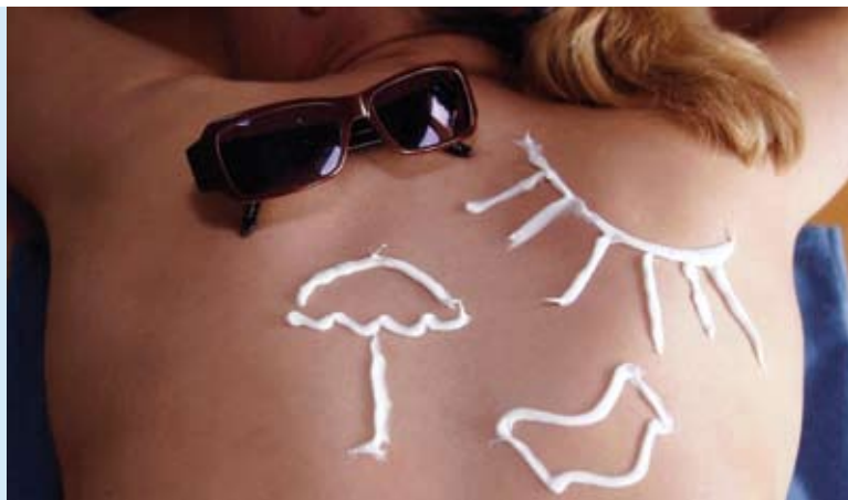
Abbildung 11: Die Sonne steigert unser Wohlbefinden und ist wegen einer Vielzahl positiver Wirkungen für uns Menschen lebensnotwendig. Übermäßige Sonnenbestrahlung kann jedoch zu chronischen Lichtschäden bis hin zu Hautkrebs führen. Um dies zu verhindern, sind ein vernünftiger Umgang mit der Sonne und effiziente Schutzmaßnahmen unerlässlich.

Wenn Sonneneinstrahlung nicht vermeidbar ist, sind Lichtschutzmittel eine ergänzende Methode, um die Haut zu schützen. Jeder, der Lichtschutzmittel anwendet, geht davon aus, dass sie nicht nur gegen Sonnenbrand und vorzeitige Hautalterung schützen, sondern auch helfen, Hautkrebs zu verhüten. Eine sichere Schutzwirkung gegen schwarzen Hautkrebs ist allerdings nicht zu erwarten. Dagegen gilt es nach den derzeitigen wissenschaftlichen Erkenntnissen als gesichert, dass durch die vorschriftsmäßige Anwendung adäquater Lichtschutzmittel zumindest dem Plattenepithelkarzinom und seiner Frühform, der aktinischen Keratose, vorgebeugt werden kann.