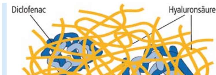
Abbildung 9: In einem Gel zur Behandlung von aktinischen Keratosen wird der Wirkstoff Diclofenac (blau) wolkknäuelartig in eine Faserstruktur aus Hyaluronsäure (gelb) eingelagert. Dadurch kann er in ausreichender Menge in die Oberhaut eindringen und lang genug dort verweilen.

Die Zubereitung ist meist gut verträglich und führt in 80 Prozent der Fälle zu einer kompletten Abheilung oder deutlichen Besserung. Das Gel wird zweimal täglich über einen Zeitraum von bis zu 90 Tagen angewandt und ist auch bei Organtransplantierten mit aktinischen Keratosen eine effiziente, sichere und einfache Therapie mit nur geringen Nebenwirkungen.