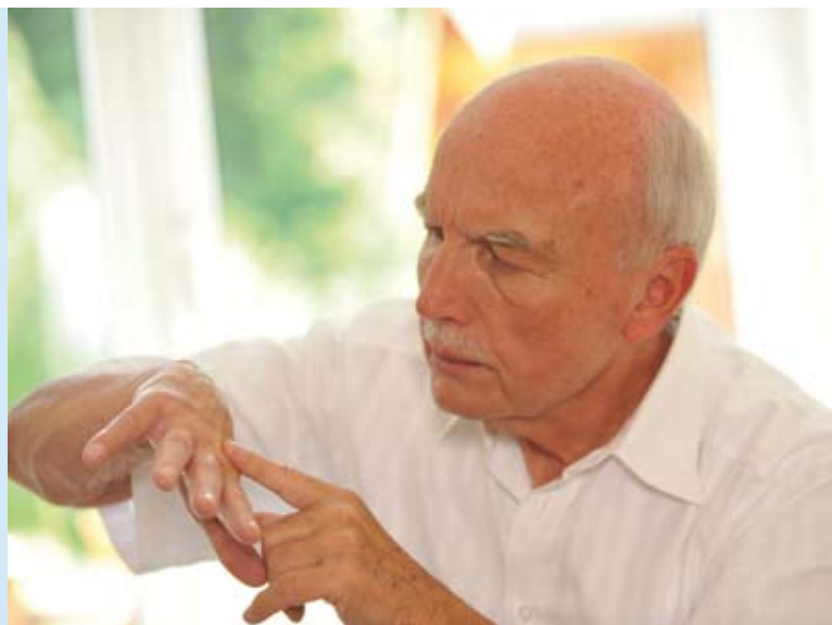
Abbildung 8: Da rechtzeitig erkannter heller Hautkrebs sehr gut heilbar ist, spielt die Prävention eine überragende Rolle. Zur Früherkennung sollte jeder seine Haut regelmäßig auf sonnenbedingte Auffälligkeiten prüfen. Werden dabei Hautstellen entdeckt, die wachsen, nässen, bluten, jucken, asymmetrisch erscheinen oder sehr dunkel sind, sollte zur Abklärung ein Hautarzt aufgesucht werden.

Die Aussichten auf eine dauerhafte Heilung sind für das Plattenepithel- und das Basalzellkarzinom sehr positiv: Bei dem letztgenannten betragen die Heilungschancen 95 bis 100 Prozent. Bei einem Plattenepithelkarzinom, das noch keine Metastasen gebildet hat, liegen sie zwischen 90 und 95 Prozent. Nach erfolgreicher Behandlung ist eine regelmäßige Kontrolle unerlässlich. Ganz wichtig ist auch die Aufmerksamkeit jedes Einzelnen für den eigenen Körper und etwaige Veränderungen. Jeder sollte seine Haut selbst regelmäßig auf Auffälligkeiten prüfen (Abbildung 8).